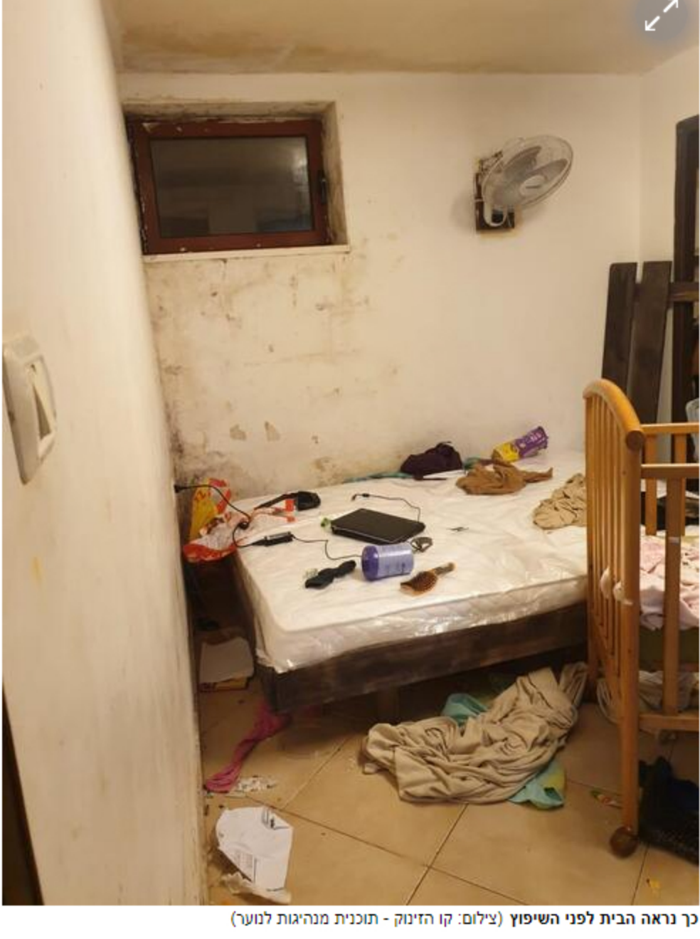
כך נראה הבית לפני השיפוץ

דרעי צילם תמונות נבחרות מהדירה ופנה אל הרשתות החברתיות בבקשה לעזרה כספית. "הרבה אנשים תרמו כסף וכך יכולתי מהר מאוד להתחיל בפרויקט השיפוץ. מיד אחרי שראיתי שהצלחתי לגייס את הכסף, פניתי שוב אל הרשתות החברתיות בבקשה למתנדבים. הגיעו הרבה חברים שלי, הגיעו אנשים שאני לא מכיר שהגיעו אלי דרך האינסטגרם, אפילו חברה ממג"ב שראו את הפרסום ורצו לסייע".