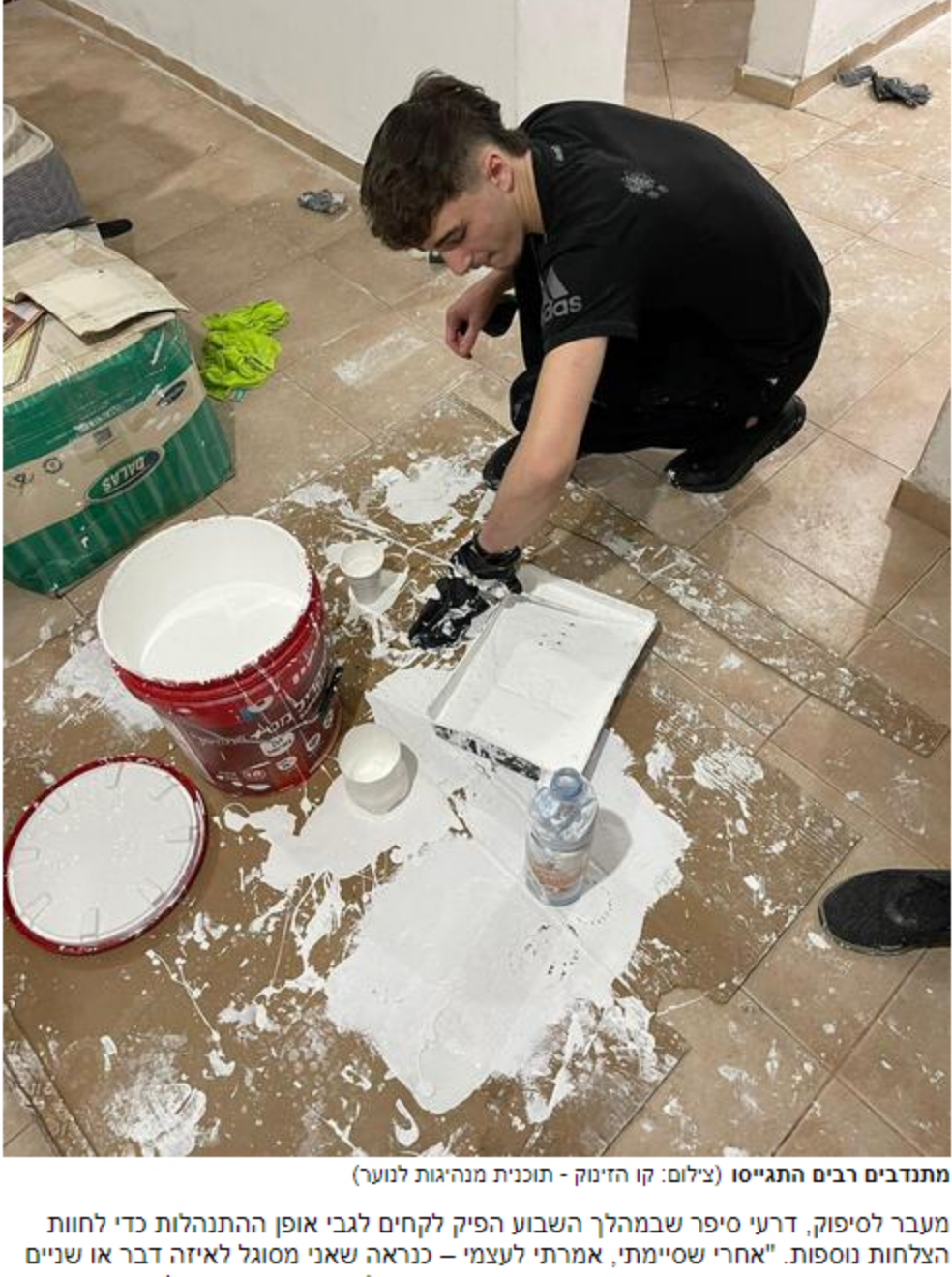
מתנדבים רבים התגייסו

לאחר השיפוץ סיפר דרעי למיינט ירושלים על ההתרגשות של בעלת הדירה כשראתה את המהפך: "כשהכל הסתיים, שמעתי אותה אומרת בשקט לעצמה שהיא לא מאמינה שזה הבית שלה. אותי אישית זה ממש ריגש כי הבנתי שעשיתי שינוי גדול עבורה. זה נתן לי תחושה אדירה בבטן ובנפש אחרי שראיתי את התוצאה הסופית. הלכתי לישון בתחושה שעשיתי משהו והצלחתי לעזור למישהו לחיות קצת יותר טוב. שמחתי שלא בזבזתי את היום במשחקים, ביוטיוב או בנטפליקס".