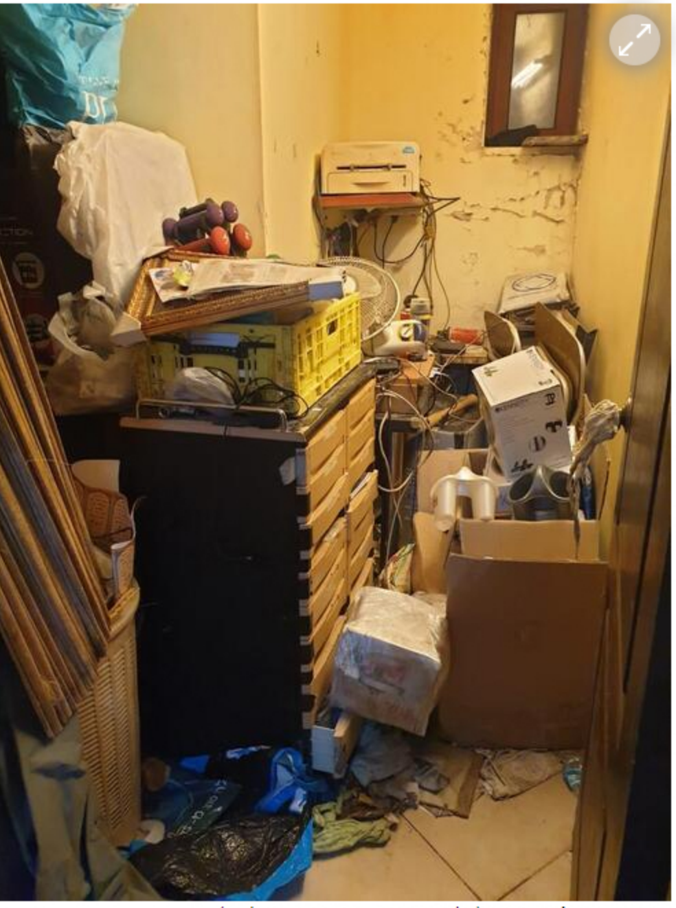
כך נראה הבית לפני השיפוץ

"סיפרו לי על אישה שיש לה סיפור משפחתי קשה והיא מגדלת 7 ילדים לבד. בהתחלה האישה הזאת בכלל לא רצתה להראות לי את הדירה שלה, אבל שכנעתי אותה שאני מגיע עם בעל מקצוע". כאשר נכנסו לדירה, הופתעו השניים לגלות את רמת ההזנחה במקום: עובש על הקירות, מיטות קרועות, אפילו עכברים. "התחרטתי. היה נראה לי שזה גדול עלי". רוב החברים שלי לקבוצה לא עשו דברים כאלה גדולים. רובם העבירו שיעור שמעניין אותם בכיתה. כשראיתי את המצב, אמרתי זה יכול לקחת לי שבועיים-שלושה. אני סך כל ילד בן 17 ויש לי לימודים. מאיפה אני משיג כל כך הרבה כסף לצבע? לבעלי מקצוע? היה צריך לטפל בדירה באופן רציני".